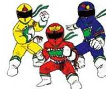
離島閃隊タネガシマン

熊毛地域の介護職員のケア・パワーから生まれた介護のヒーロー。介護職員の夢が込められた「バトル」スーツを身につけている。