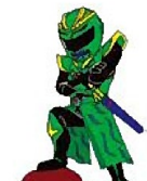
緑の閃光マゲジマン

雄龍離龍之神の選い、雄龍&離龍の人間たちを愛する心に触れたことで種子島での暮らしを選び、タネガシマンと行動を共にしている。