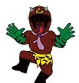
兵士ジャバッチェ

種子島の隣の兄弟島「馬毛島」のヒーロー。もとは、馬毛島に暮らす大鹿の化身。ジャスロウから龍之宝珠を取り戻すべく戦っている。