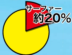
22の施設等職員の1ターン者のうち、サーフィンをする人の割合