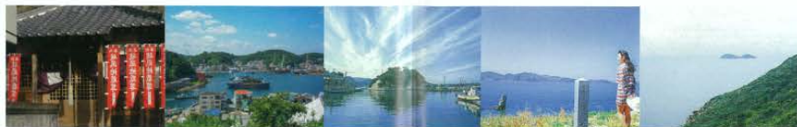
赤坂清水・櫻谷雪景 (あかさかしみず・さくらにだけゆき)