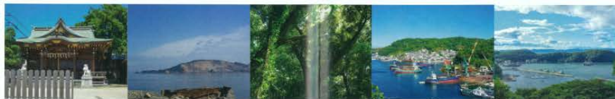
白髭堂河 (しらひげのいし)